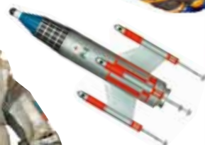
怪獣大戦争 P-1号 (1965)