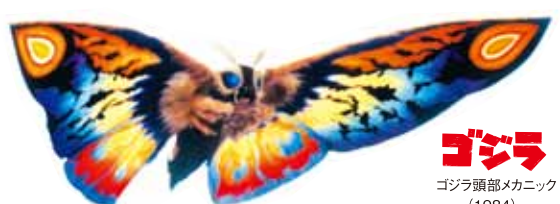
モスラ3 レインボーモスラ (1998)