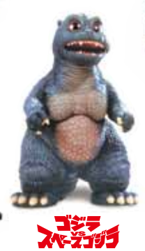
ゴジラ リトルゴジラ (1994)