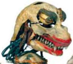
ゴジラ ゴジラ頭部メカニック (1984)