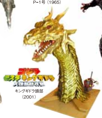
キングギドラ頭部 (2001)