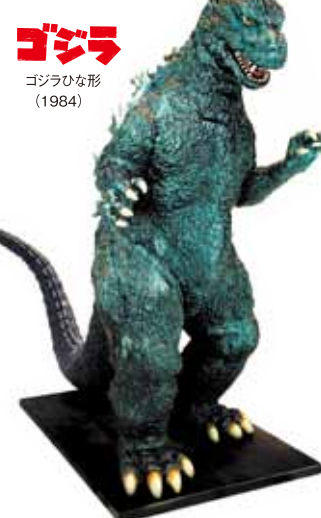
ゴジラ ゴジラひな形 (1984)